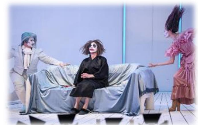
Всероссийский театральный фестиваль «ПоМост №9»