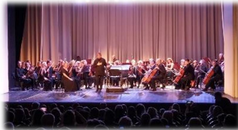
Двенадцатая музыкальная детская академия стран СНГ под патронажем народного артиста СССР Юрия Башмета