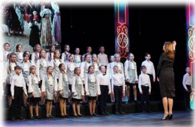
Участие сводного хора в Пасхальном концерте под патронатом Владыки Сергия, Митрополита Самарского и Новокуйбышевского